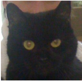
Fundkatze aus Nordleda kastrierte Schmusekatze hat ein Tattoo in den Ohren von 2007 weiteres ist leider nicht lesbar.