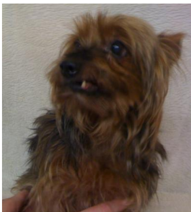
Kleine Yorkshire Hündin Älteres Baujahr, lief in der Drangst Markantes Zeichen linker Schneidezahn sichtbar