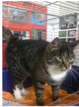
Kater in der Wohnung zurückgelassen.