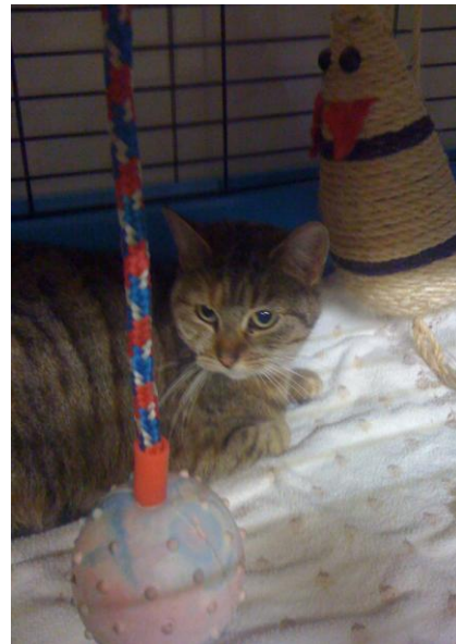
Fundkatze aus Cuxhaven.